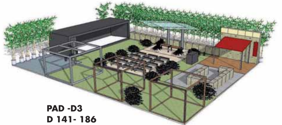
PAD -D3 D 141- 186