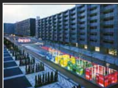
Paesaggio in luce Martha Schwartz GIFU KIGATA APARTMENTS GARDEN