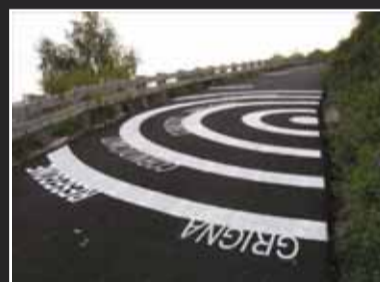
Slow Landscape Ifdesign IL MURO DI SORMANO