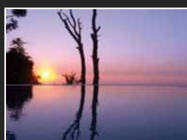
Top water Frederic Frances ALEY GARDEN ANIMA AN- TICA