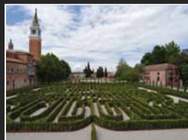
Labirinth Garden Il Labirinto Borges Il Labirinto di bambù di Franco Maria Ricci