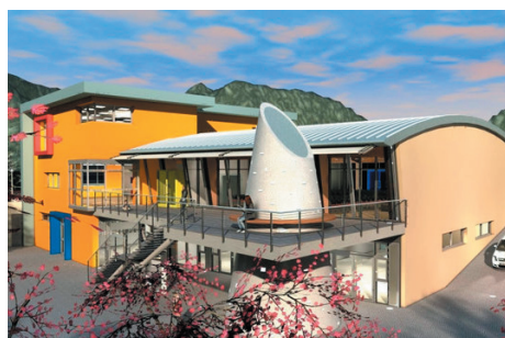
Nuovo Centro Giovani