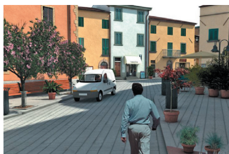
Studio di arredo urbano