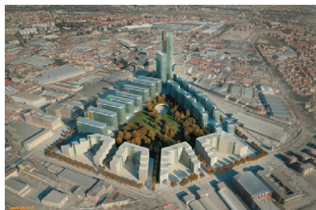
Complesso residenziale e servizi