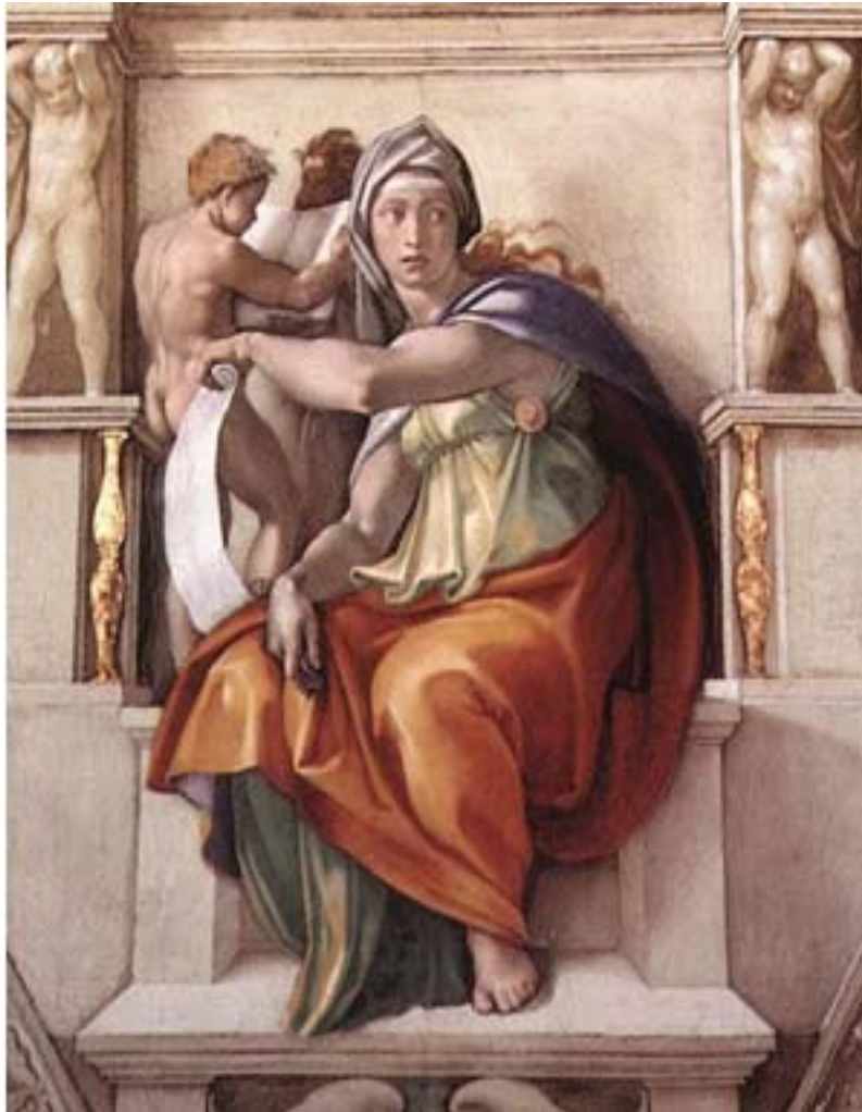
Michelangelo-Sibilla Delfica (Cappella Sistina)

Associazione Amici di Brera e dei Musei Milanesi-via Brera 28-20121 Milano-tel.02 860796 -02 72023519-fax 02 867354-www.amicidibrera.milano.it info@amicidibrera.milano.it